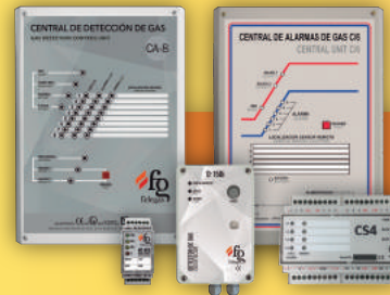
UNITÉS DE CONTRÔLE/ CENTRES D'ALARME