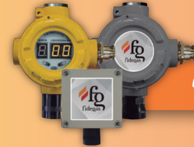
CAPTEURS À DISTANCE